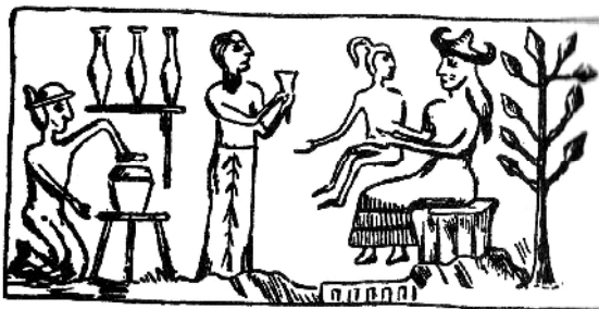
Tanrı Ninmax doğduğu ilk uşağı göstərir ki, bunu mən yaratmışam

Bu parçada kişinin arvad alması, arvadın ərə getməsi, onların bir yastığa baş qoyması, uşağın ana bətninə düşməsi, doqquz ay, doqquz gün orda böyüməsi, boylu qadının öz yükünü yerə qoyması, bu doğumun şadlıqla, şənliklə keçirilməsi o qədər real bədii ifadəsini tapmışdır ki, elə bil poema beş min il öncə yox, lap bizim günlərdə yazılıb. Poema beş min il öncə yazıya alınsa da, onun tarixi daha qədimdir. Əsər yəqin ki, neçə min il də ağızlarından ağızlara ötürülə-ötürülə yaşamışdır. Çünki yazı kəşf ediləndə bu əsərlər bizim oxuduğumuz şəkildə yaddaşlarda mövcud olmuşdur. Bu cür bitkin, gözəl bir şəklə düşənə qədər də sözsüz ki, min illərlə yaddaşlarda cılalınma, püxtələşmə yolu keçmişdir.