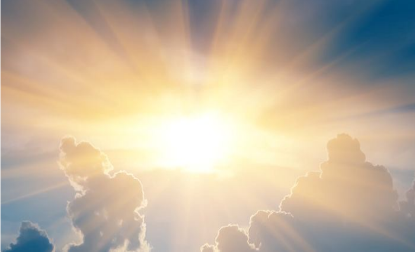
Şəkil 11. Xızır Əleyhissəlam

görə Xızır qeyb aləmini, bilinməyənləri bilən və Allahın (cc) sevimlisi bir quldur.