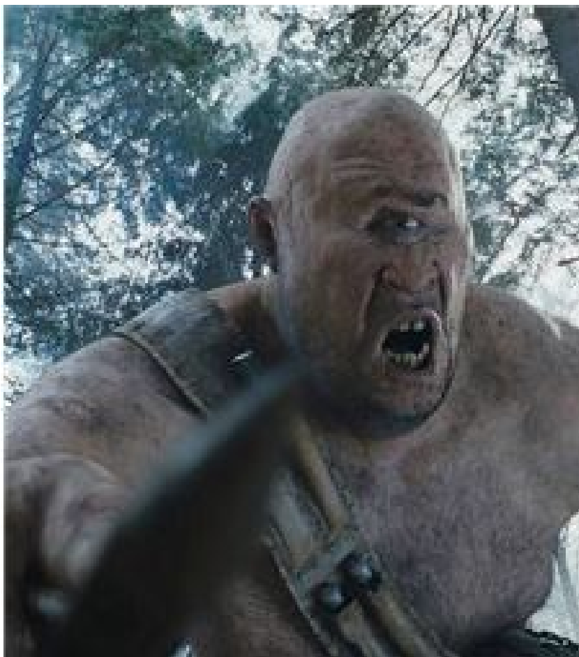
Şəkil 13. Təpəgöz

pəgözün mifoloji obraz olması onun qeyri-adi gücə, soykəkə malik olması, xaosu təmsil etməsi, ölümü simvollaşdırmasına görədir.