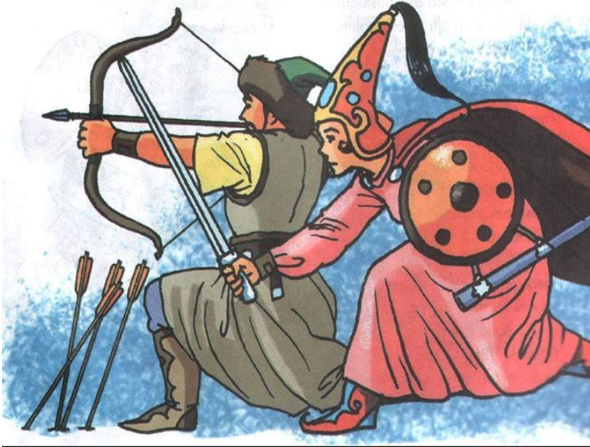
Şəkil 8. Boz atlı Beyrək

Oğuznamə boylarında qəhrəmanlığı ayrıca öyülən qazilər vardır ki, haqqlarında müstəqil dastan olmasa da, bu alp-ərənlər kafirlərlə savaşların hamısında iştirak etdiklərinə, eyni epitetlə xatırlanmışlarına və qazavata qatıldıklarına görə qazidirlər.