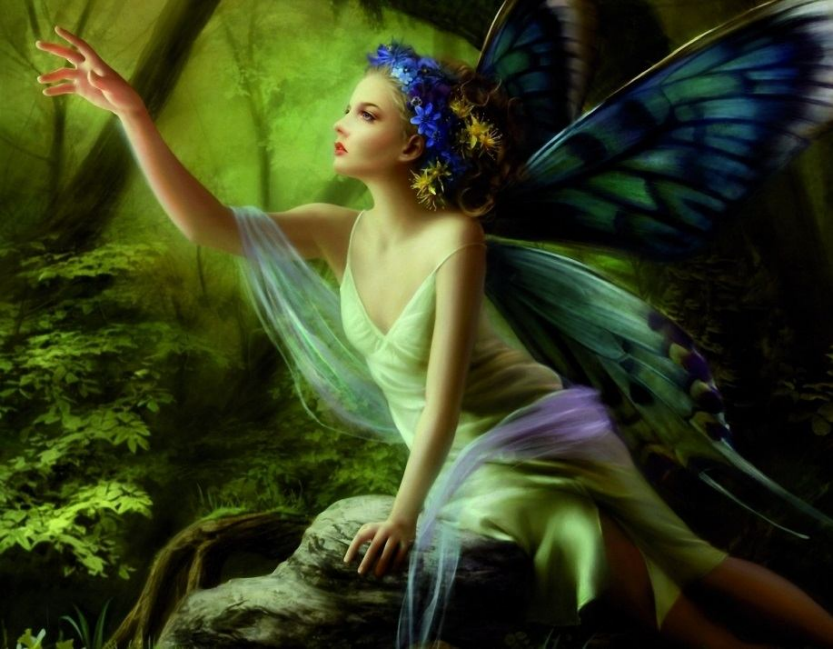
Şəkil 12. Pəri

olaraq türk folklorunda pəri qeyri-adi gözəlliyi və sehrli gücü ilə bilinən başqa bir dünyanın varlıqlarıdır. Onların əsas özəlliyi göyərçin donuna girərək yaşamaları, qəhrəmanlara yardım etmələridir. Dədə Qorqud dastanı “Basat Təpəgözü öldürdüyü boyu”nda da pərilər göyərçin donundadırlar. Bir qayda olaraq pərilər su qırağında, meşələrdə yaşasalar da mifoloji əfsanələrdə onların məskəni bəzən Qaf dağı, bəzən yeraltı dünyası, bəzən də səmadır. Türk xalqlarının folklorunda pəri müsbət obraz olsa da onun bəzən insanlara zərər verdiyi də görünür. Pərilər yaşlanmaz, qocalmaz və gözəl-