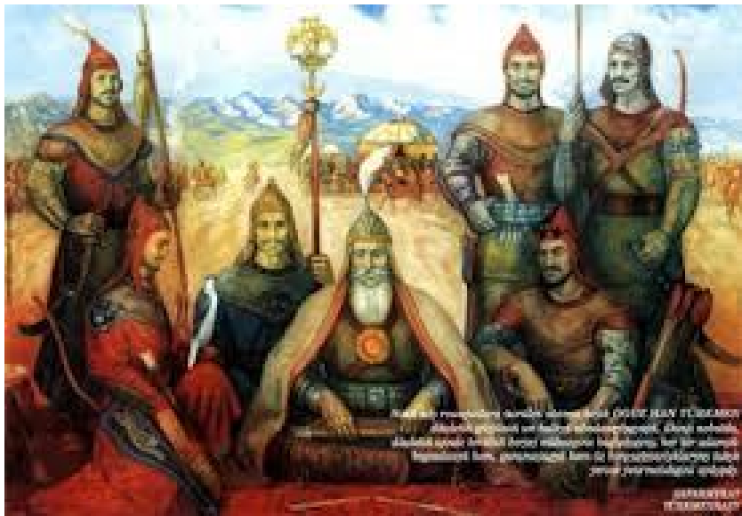
Şəkil 2. Oğuz Kağan və altı oğlu

belə yarandı. Bunun üçün də onlara kanğa adını qoydular. Oğuz Kağan arabaları gördü, güldü, belə dedi: Araba ilə cansız qəniməti canlı qənimət çəkib aparsın. Kanğaluğ sizə ad olsun. Bilginiz də araba olsun). Ad vermə Dədə Qorqud dastanlarında Qorqud Atanın funksiyasına daxildir.