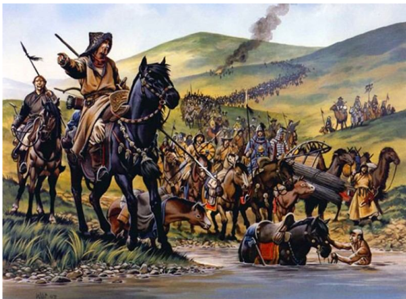
Şəkil 7. Qazan Xan səfərə çıxır

zan Xan Oğuz dövlətində ikinci şəxsdir. Alplar başı Qazan Xanın ən başlıca özəlliyi savaşı vaxtı ən öndə döyüşməsi, ildə bir dəfə xanımının əlindən tutub evdən çıxması və evini yağmalatmasıdır.