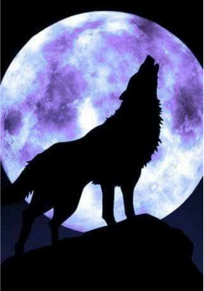
Şakil 10. Bozqurd