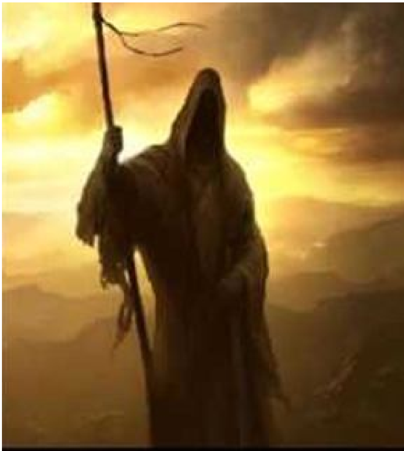
Şəkil 6. Əzrail

edilir: “Hak Taalaya Dölü Dumrulun sözi xoş gəldi. Azrailə əmr eylədi: Dölü Dumrulun atasının anasının canını al, ol iki halala yüz kırk yıl ömür virdim didi” 41 .