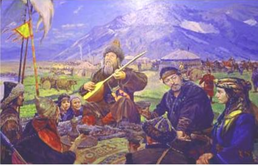
Şəkil 4. Dədə Qorqud

alplıq adının, həm də onun sosial statusunu müəyyənləşdir- diyi məlum olur.