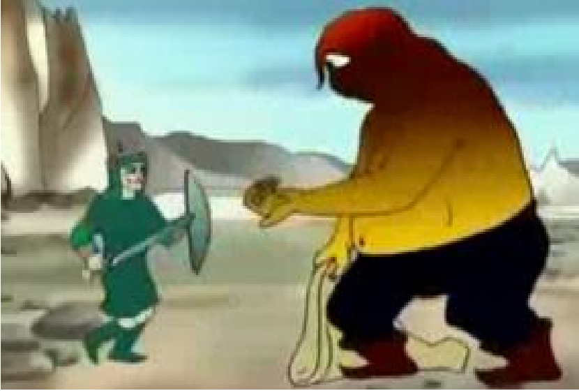
Şəkil 5. Basatın Təpəgözlə döyüşü

fövqəl qüvvələr və görüşlərlə bağlıdır, çünki onunla böyüdü- külən qəhrəmanlara fəvqəltəbii güc verilir. Basatın belə gü- cə malik olmasında, öz elinə, torpağına bağlılığında bu qüvvələrin təsiri də az deyildir. Basat Təpəgözlə sadəcə qardaşının intiqamını almaq, fiziki gücünü nümayiş etdir- mək üçün savaşırmır o, Oğuz elinə təhlükə yaradan xaosu