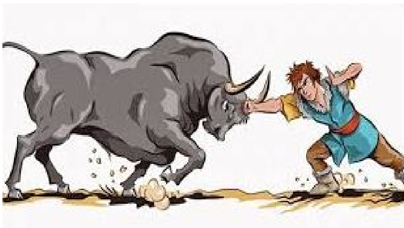
Şəkil 3. Buğacın buğa ilə savaşı

1. Qəhrəmanın igidliyi, ərđəmliyi. Buraya anaya, qadına hörmət, kişinin ailədə mövqeyi, igidliyin oğuz qəhrəmanları üçün bir ərđəm olması, ata, qardaş qanını və ya intiqamını almağın fəzilət olması və s. daxildir. Bayındır Xanın ağ meydanında azğın buğanı basıb başını kəsən gənc alpın simasında ozan ərđəm və hünərin nə olduğunu aşağıdakı kimi sıralayır: