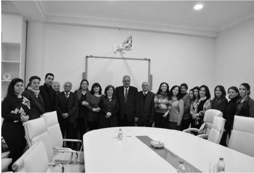
AMEA Nizami adına Ədəbiyyat İnstitutunda (18 fevral 2016)