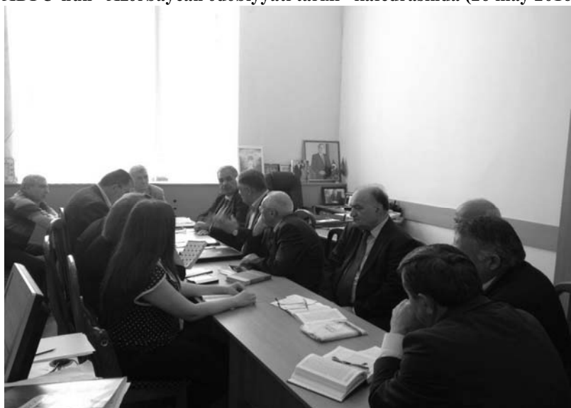
ADPU-nun "Azərbaycan ədəbiyyatı tarixi" kafedrasında (26 may 2016)