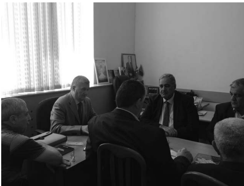
ADPU-nun "Azərbaycan ədəbiyyatı tarixi" kafedrasında (26 may 2016)