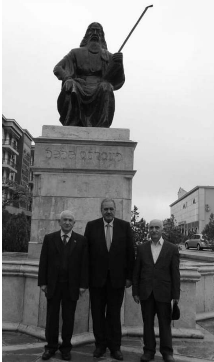
Kamran Əliyev Naxçıvanda keçirilən “Dədə Qorqud” simpoziyumunda xarici qonaqlarla birgə (26-27 oktyabr 2015)