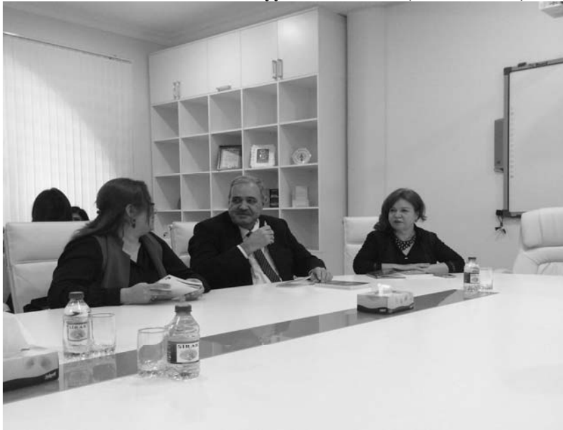
AMEA Nizami adına Ədəbiyyat İnstitutunda (18 fevral 2016)