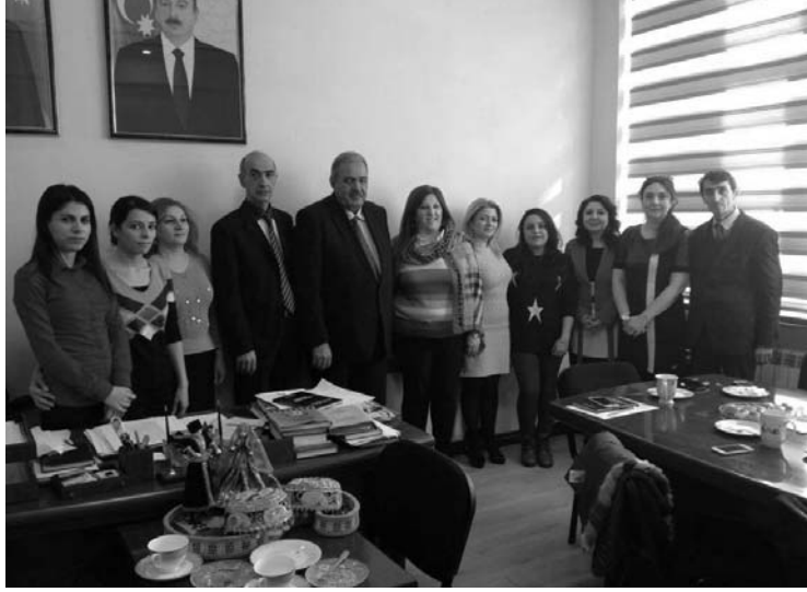
Bakı Dövlət Universitetinin “Azərbaycan şifahi xalq ədəbiyyatı” kafedrasında (2 dekabr 2015)