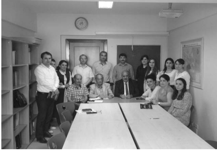
BMU-nun “Azərbaycan dili və ədəbiyyatı” bölümündə (10 iyun 2016)