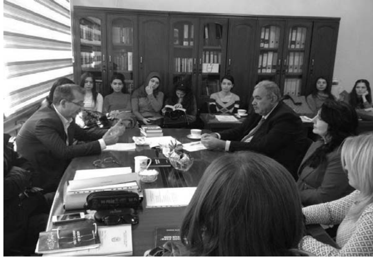
Bakı Dövlət Universitetinin “Azərbaycan şifahi xalq ədəbiyyatı” kafedrasında (2 dekabr 2015)