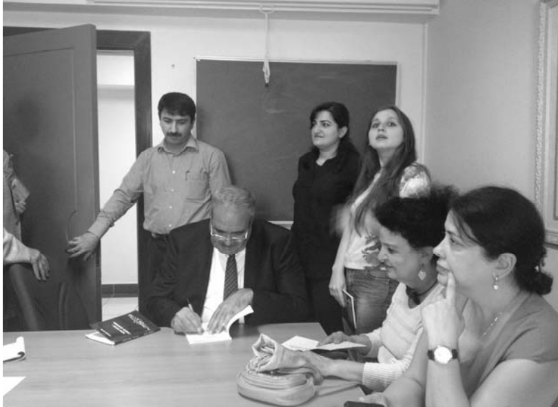
BMU-nun “Azərbaycan dili və ədəbiyyatı” bölümündə (10 iyun 2016)