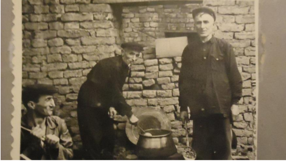
Udi toyunda yemək bişirilməsi