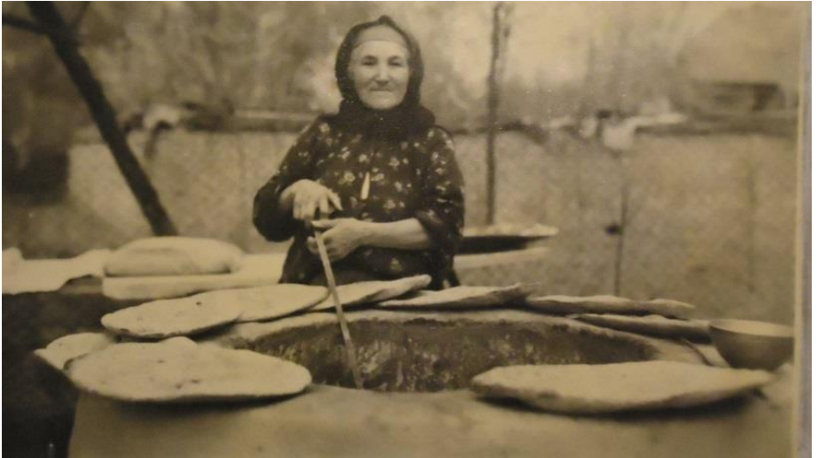
Təndirə çörək yapan udi qadını