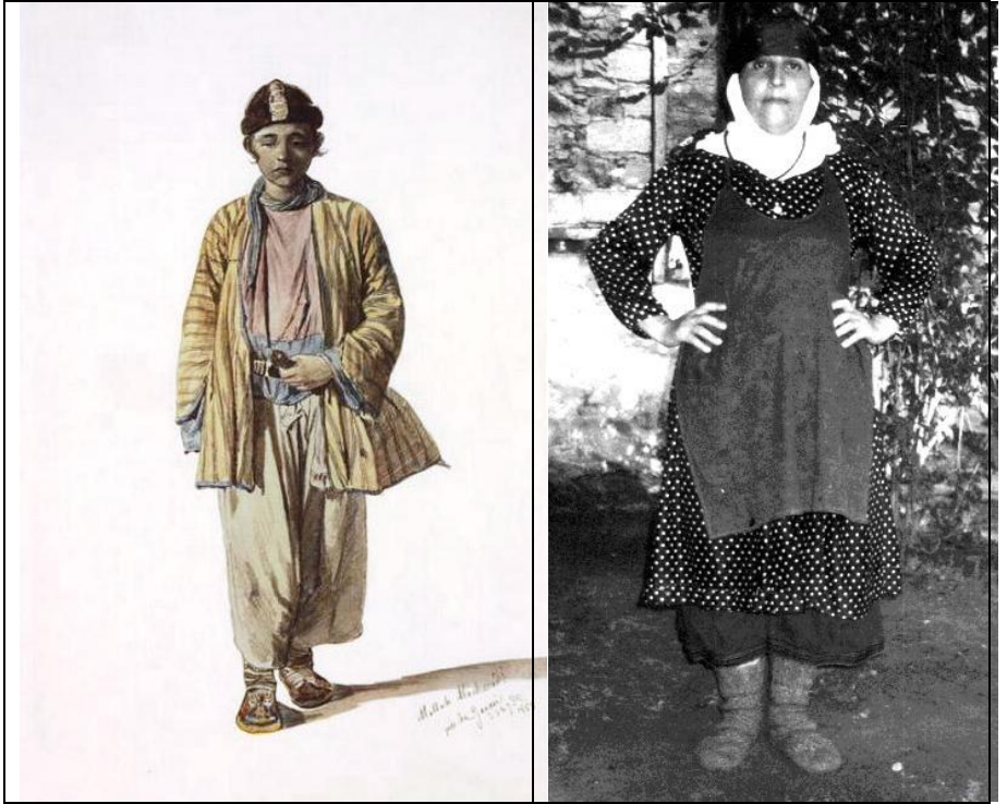
İngiloy milli geyimində müsəlman kişi və müasir ingiloy qadını