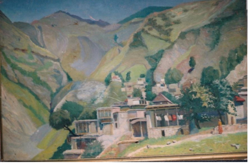
Köhnə Suvagil kəndinin rəsmi. 1959-cu ildə rəssam Salam Salamzadə tərəfindən çəkilməşdir