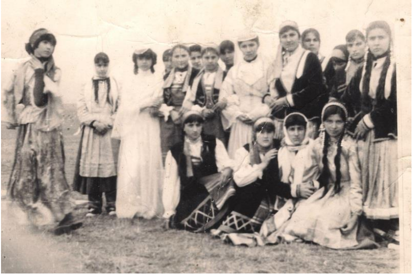
Qızlardan ibarət Lilay ansamblı