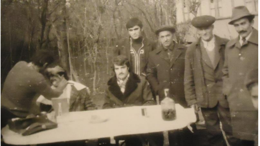
Udi toyunda bəyin üzünün çaxırla qırılması