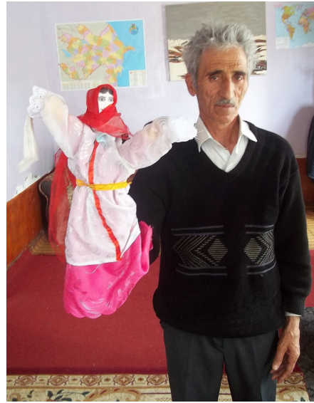
Maral və kilimarası oyunlarına aid şəkillər