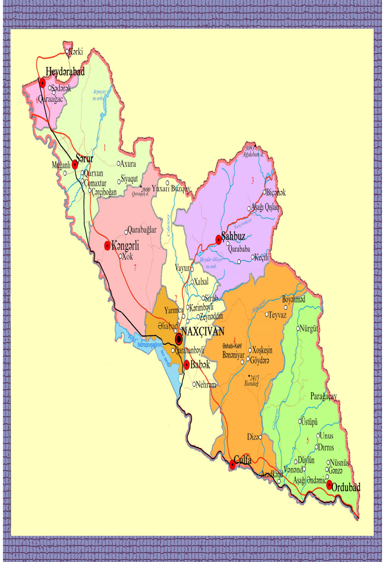
NAXÇIVANIN FOLKLOR XƏRİTƏSİ